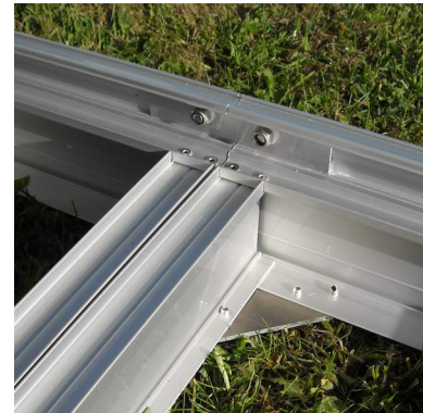
Sivukiinnikkeet valmis, sisäpuoli.