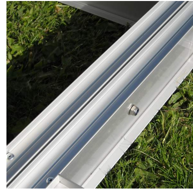
2. Keskikiinnikkeet valmis.