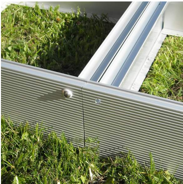
4. Sivukiinnikkeet ennen sidosruuvia.