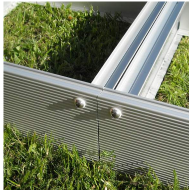
5. Sivukiinnikkeet valmis.