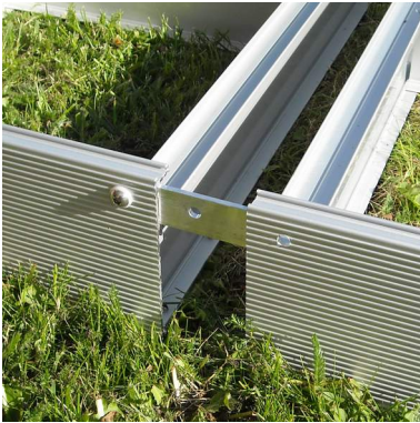
1. Elementit lähekkäin.

Elementit luivutetaan lähelle toisiaan. Sen jälkeen tehdään keskikohtien kiinnitys. Lopuksi ruuvataan sivuuvit kiinni.